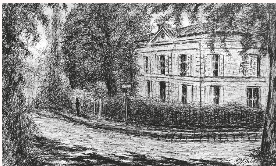
"L'ombre de Max Linder" par Claude Abdy-Baba - Mai 2022 - Avenue du Port (Cavernes) - Encre de chine sur papier "Comme dans une salle de cinéma, la lumière se projette sur l'écran, une ombre s'éloigne dans le silence et le noir et blanc."

*Qu'est ce que le SIVOC ? Le "Syndicat Intercommunal à Vocation Culturelle", rassemble 7 communes de la Presqu'île depuis plus de 20 ans. Il propose aux 60 000 habitants du territoire une programmation riche, variée, accessible mais aussi exigeante pour tous les publics.