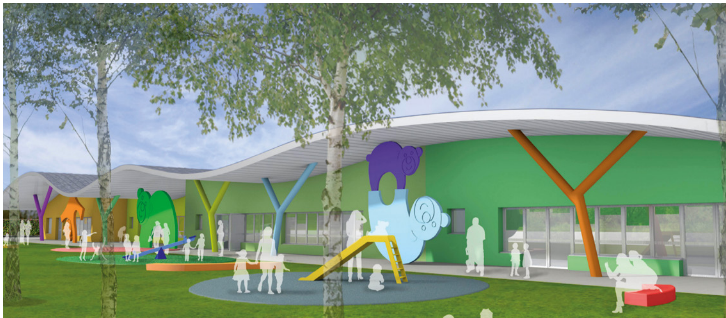
Pôle petite enfance

Concernant l'aide à la famille , nous vous avons proposé la construction d'une nouvelle crèche en lieu et place de l'actuelle "Les P'tits Loups" devenue trop petite et mal adaptée, ainsi que la mise en place d'un RAM (Relais Assistantes Maternelles).