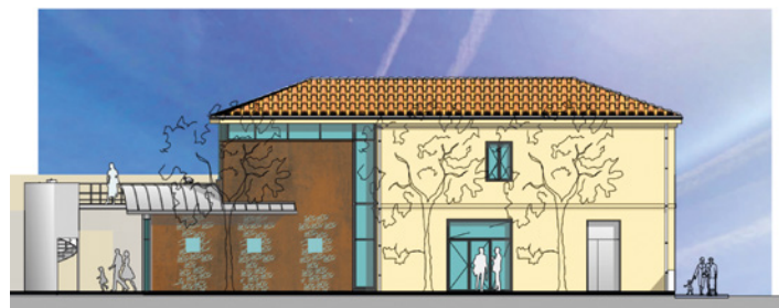
Salle des mariages

Le temps de réponse des assurances, des études de faisabilité, de mise en place des marchés nécessaires, de recherche des entreprises font que ces travaux se réaliseront en 2018.